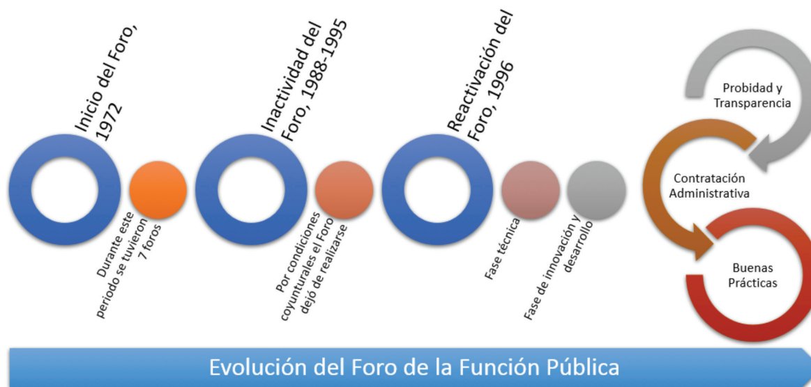
Ilustración 1. Proceso Evolutivo y Estratégico del Foro de la Función Pública

Es así como, en 1996, el Instituto Centroamericano de Administración Pública -ICAP- propone la creación de un foro regional en torno a la temática de la función pública, el cual incluyera a todos los países de la Región y fuera de carácter permanente. Desde ese momento, el ICAP se convierte en la Secretaría Técnica del foro (ICAP, 2012).