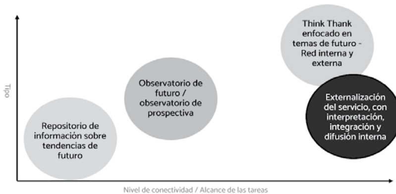
Organizacion de la Prospectiva Estratégica en las organizaciones. Tipología.