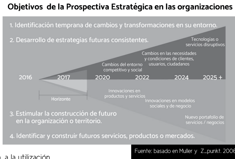
Figura 2. Objetivos de la prospectiva estratégica

Por otra parte, objetivos más relacionados con estimular la construcción de futuro de la organización y la identificación, diseño y construcción de futuros nuevos servicios, nuevos productos o nuevos mercados.