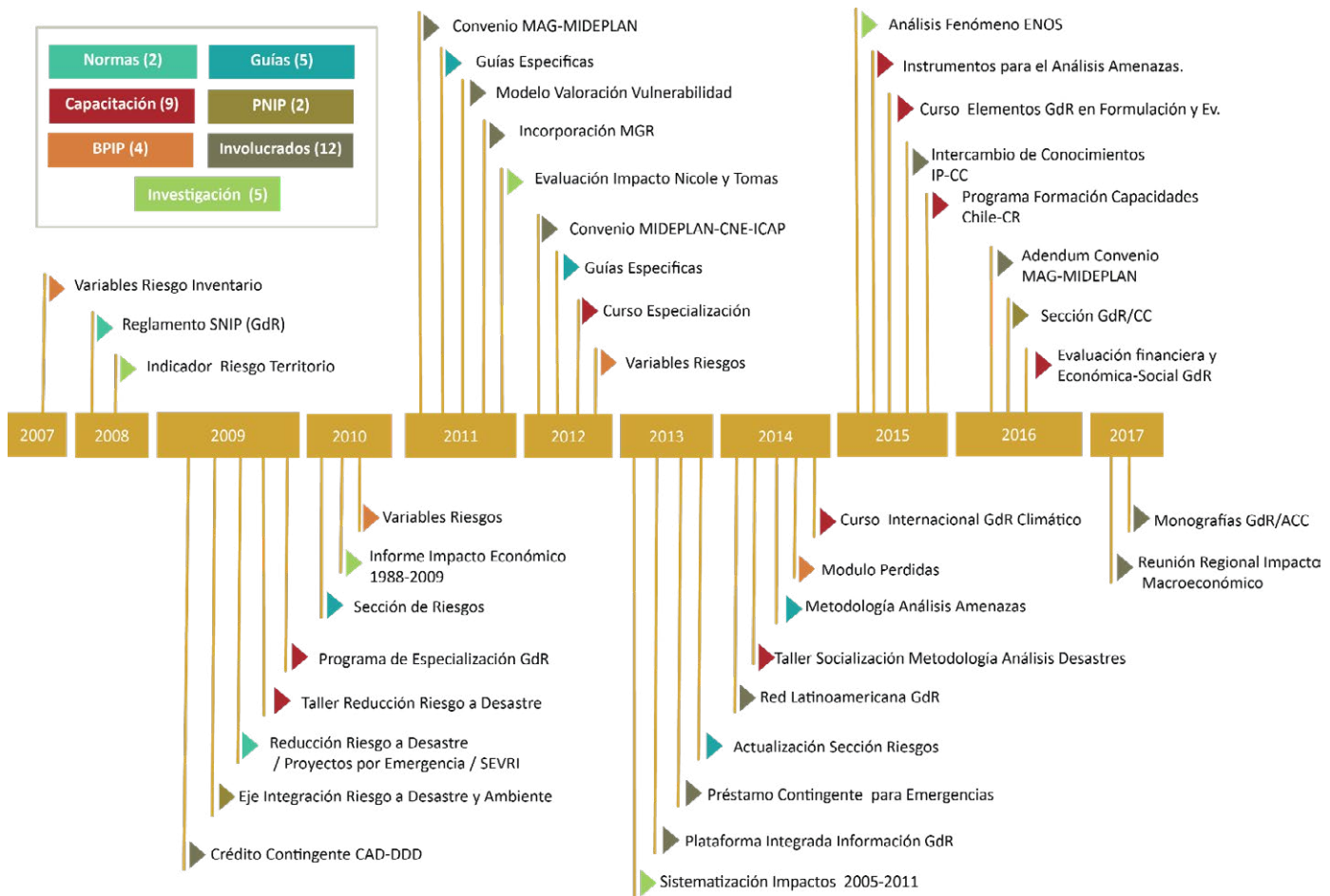
Figura 1. Cronología de la GdR y la AC en el SNIP.

Dada la necesidad de posicionar la cultura de proyectos, en el 2008 se publicó el Reglamento para la Constitución y Funcionamiento del Sistema Nacional de Inversión Pública de las Normas Generales y Definiciones (Decreto Ejecutivo 34694 PLAN-H), en el que se señala la necesidad de fortalecer las capacidades institucionales, previendo la inclusión de la GdR dentro de las Normas Técnicas, esto conforme la Ley Nacional de Emergencias y Prevención del Riesgo N°8488.