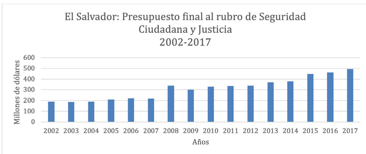
Gráfico 3: Presupuesto ejecutado en el rubro de Seguridad Ciudadana y Justicia en el periodo 2002-2017

Fuente: Elaboración propia con base a datos del Gobierno de El Salvador (2002-2017).