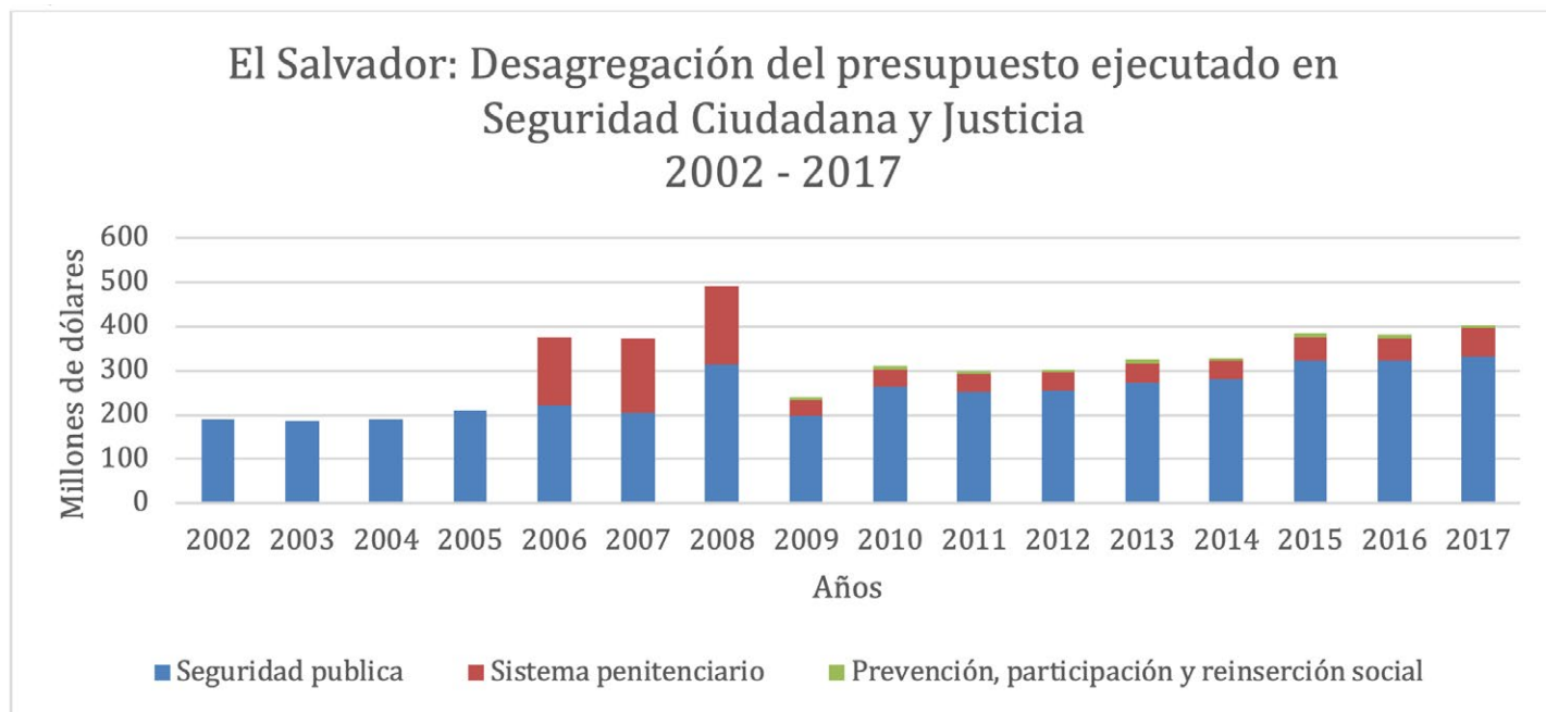
Gráfico 4: Desglose del presupuesto ejecutado en el rubro de Seguridad Ciudadana y Justicia en el periodo 2002-2017 7

Fuente: Elaboración propia con base a datos del Gobierno de El Salvador (2002-2017).